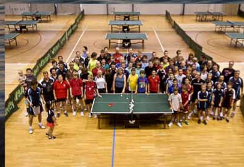
Training Pfingsten: Sonntag bis Donnerstag, Dienstag Nachmittag frei. Training August/September: Montag bis Freitag, Mittwoch Nachmittag frei.

TT-Xpert GbR Donauwörtherstr. 78 86154 Augsburg Telefon: 08 21-3 19 90 49 Fax: 08 21-3 19 90 51 e-mail: augsburg@tt-xpert.de